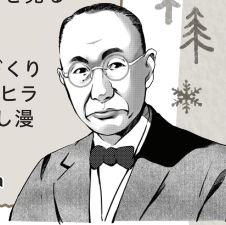
Illustration by SHIHIRA Tatsuya

八雲町出身で八雲町まちづくり 応援大使でもある漫画家シヒラ 竜也さんの貴重な書き下ろし漫 画パネルも展示。